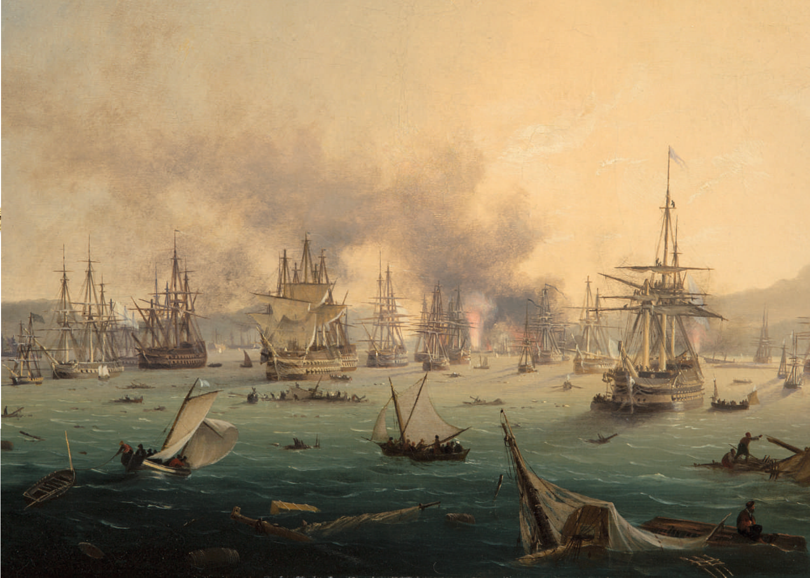
Au dessus : Ambroise-Louis Garneray — Paris, 1783-1857. La bataille de Navarin le 20 octobre 1827 . Huile sur toile. Vers 1827/1845. Vendu 769 000 € En haut à gauche : Van Cleef & Arpels , ensemble «Chevrons». Vendu 64 000 € En bas à gauche : Vente Autoworld | Auction & Motion, Bruxelles, résultat de plus de 4 M €